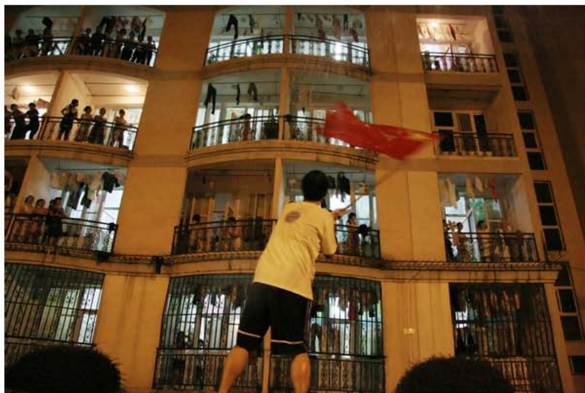
毕业游行，楼上总能有人呼应，可惜，由于一个一个承诺竟然错过了