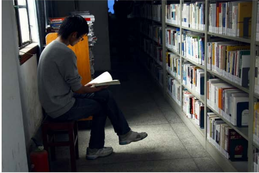
图书馆，外表破旧，内容丰富