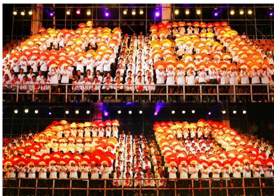
60 大庆，这是我学生的精彩表演