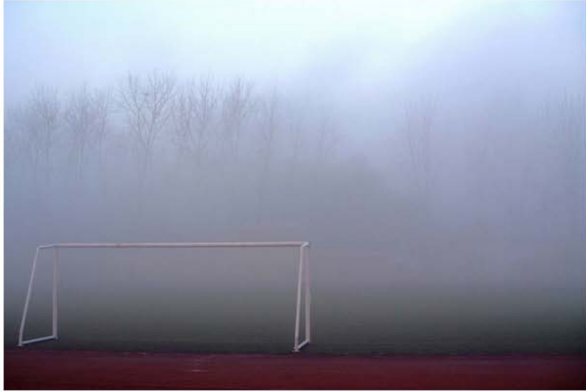
足球场，少儿甜蜜的回忆