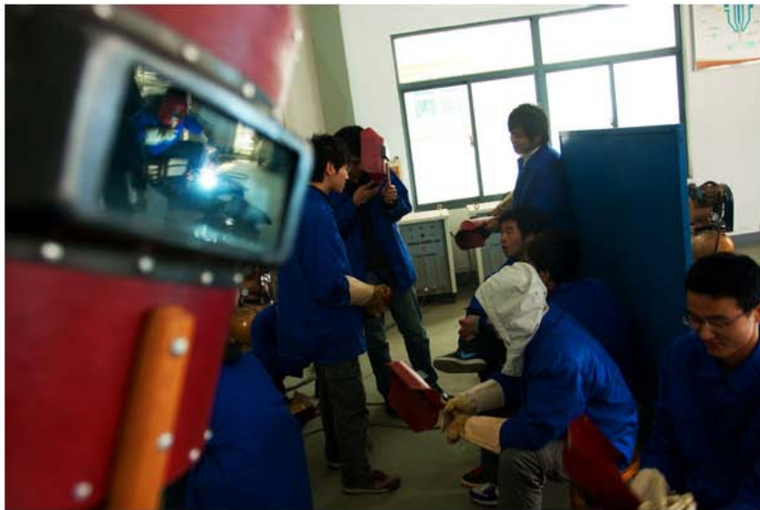
金工实习，我们也曾做过真真切切的蓝领