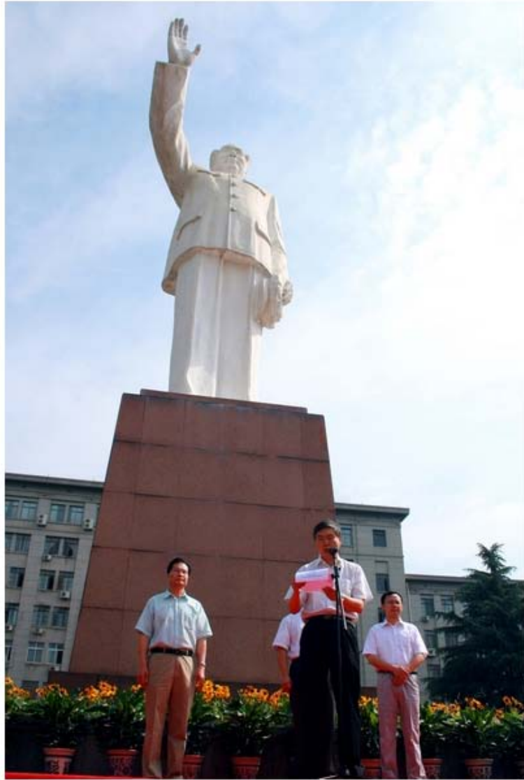
在共和国的光辉下成长