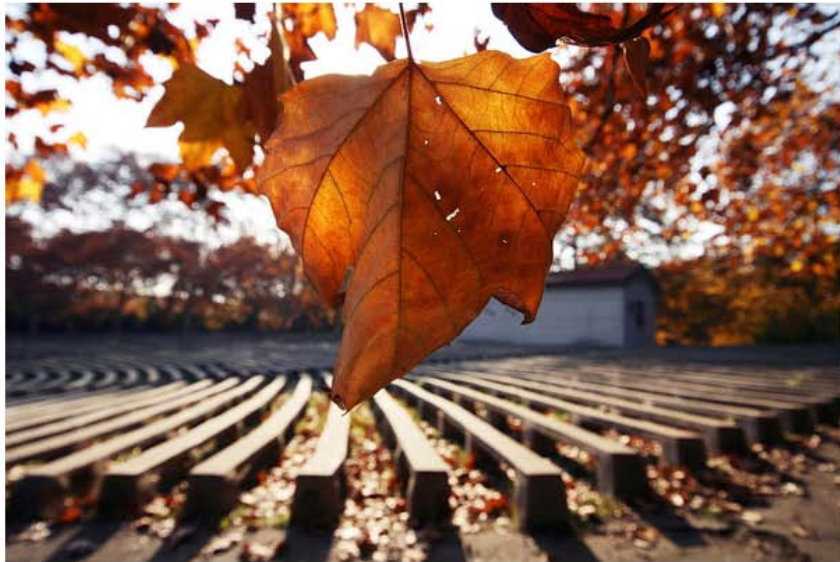
露天电影院，已成永远的回忆