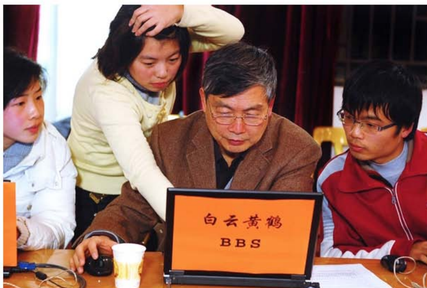
根叔，左边是学院原先的美女李导，pgli 为我们熟悉