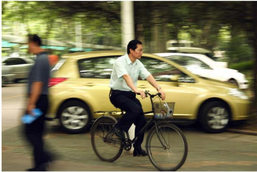
欧阳书记，修养极高，这一刻成了永恒的经典