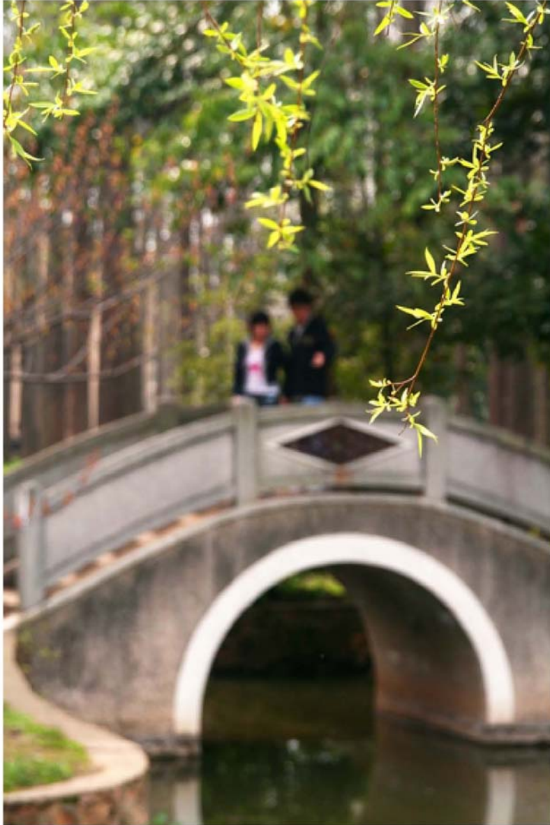
青年园的拱桥，每次推车都很不方便，使用寿命无极限