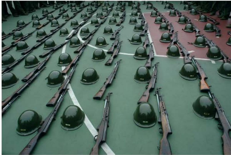
这枪不知道生产多少年了，每年拿出来时也就搽些油