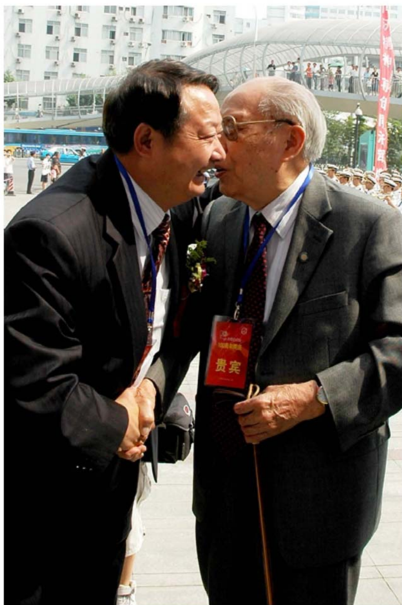
德艺双馨的裘老和老书记