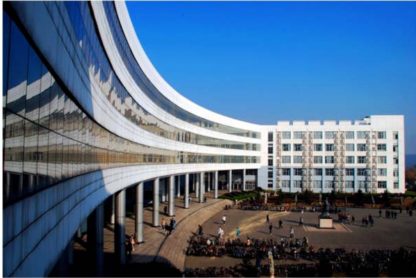
东九，永远忘不了第一次去的感觉