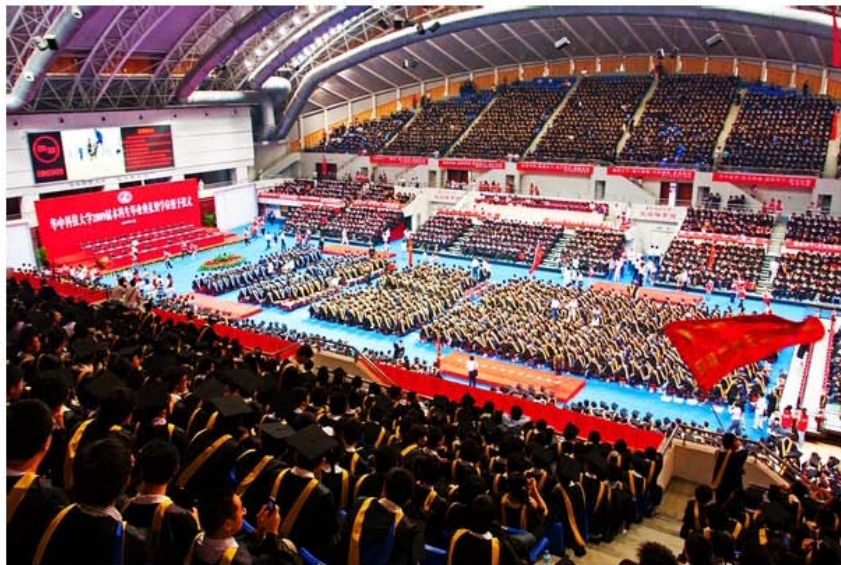
史上最牛毕业典礼，我在其中，根叔的《牵挂》，让很多人流泪