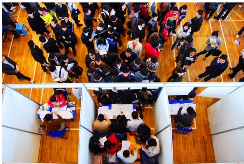
招聘会，至今没有去过