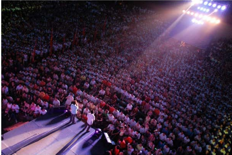
露天电影院，迎接我们的地方