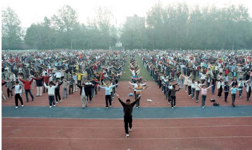
三早，是一种境界接，12点睡觉6点起床很有挑战