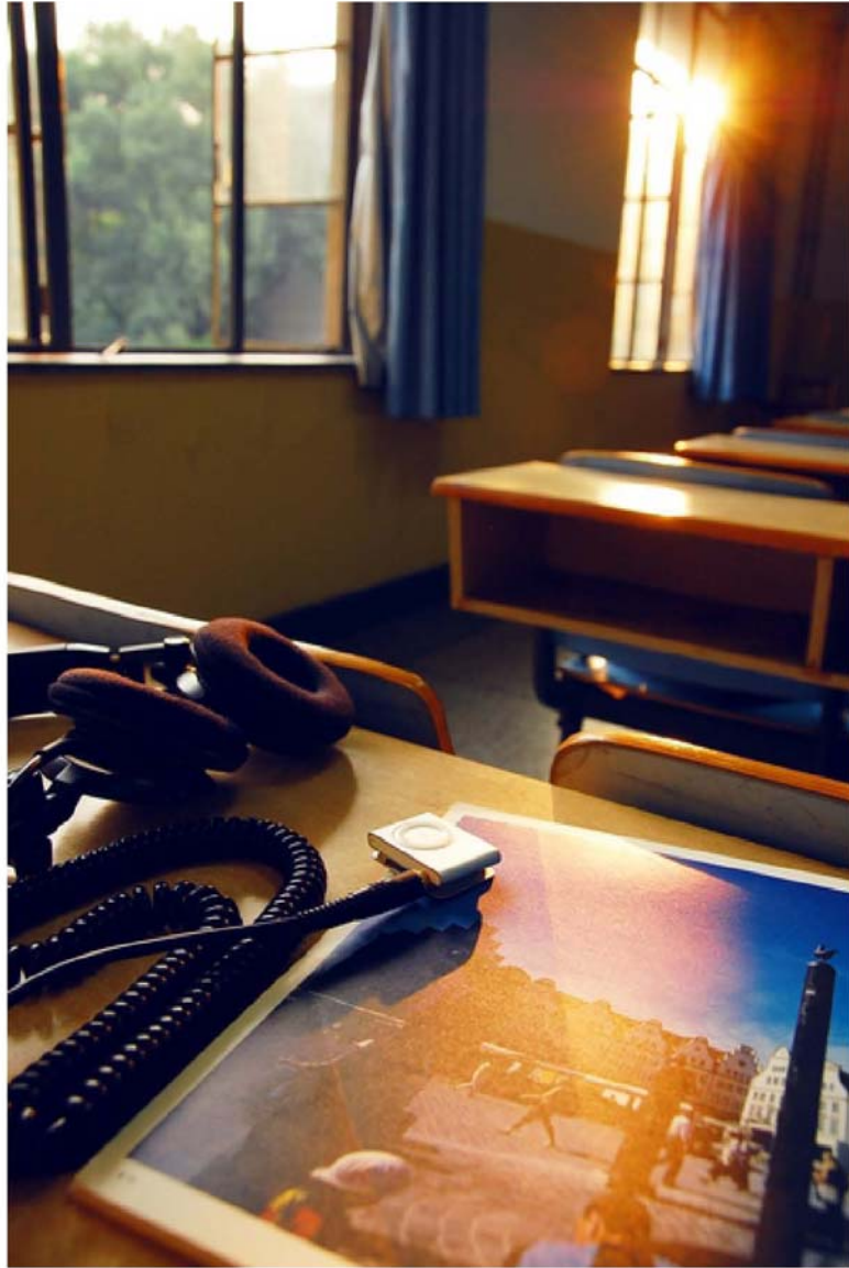
西五，上课最多的地方