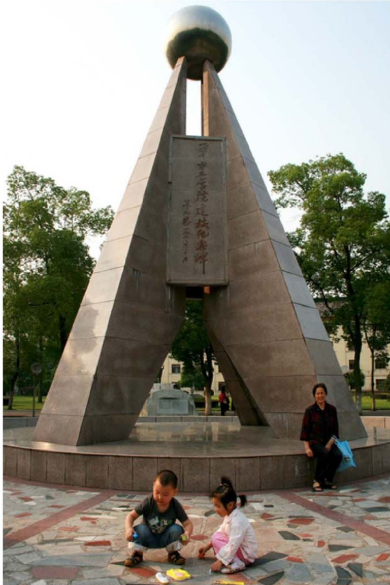
四年顶个球，只有经历了才会知道