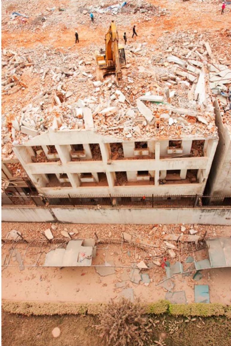
墮落街，只剩下回忆