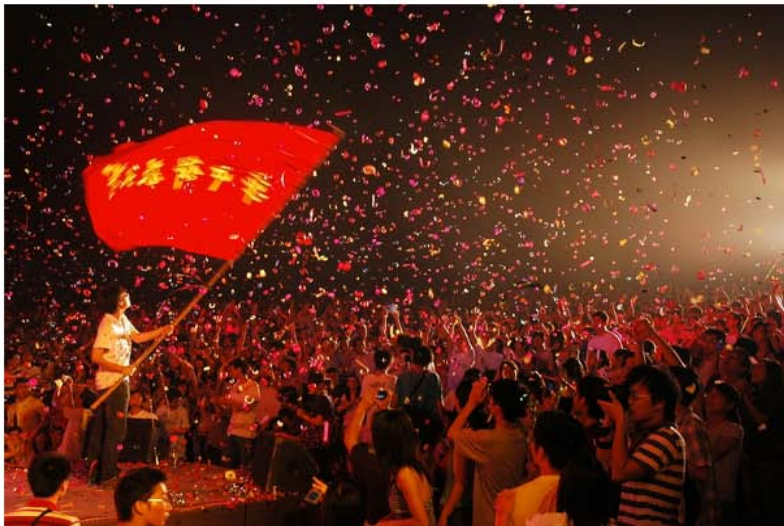
光体，送别我们的地方，那一夜，根叔曾高歌一曲