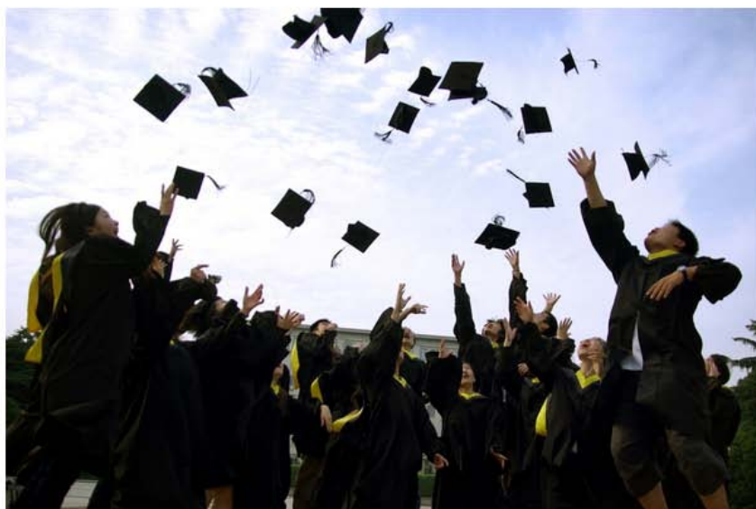
扔学士帽也是惯例，四年就等这一刻