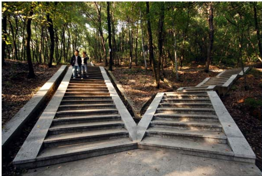
喻家山，有点矮，每次都不尽兴