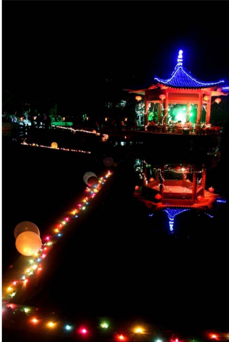
醉晚亭，美好的回忆回到永远