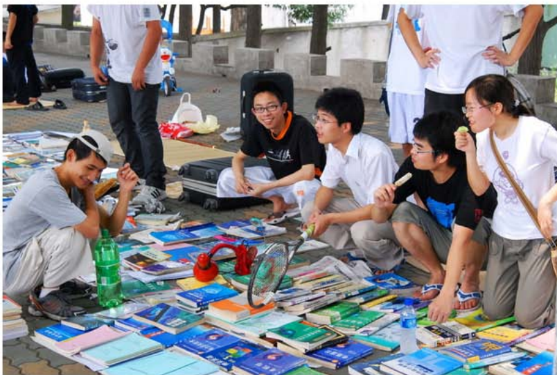
卖书，毕业生的例行公事