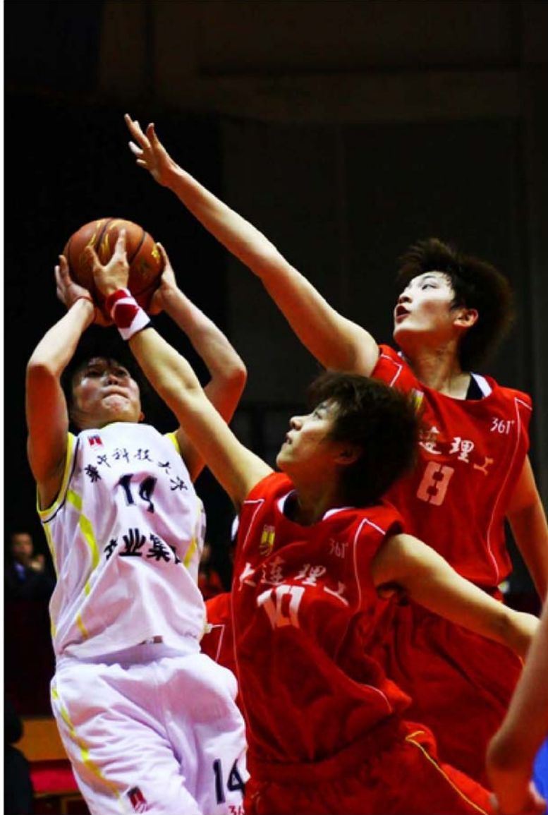
女篮，千年老二，机会就在今年