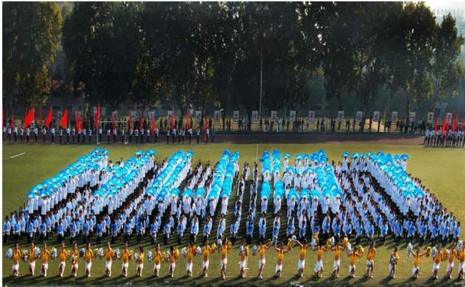
HUST AND HUSTER FOR EVER